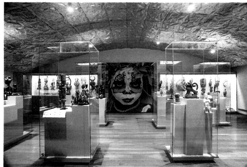
Fig. 3. Colección de Arte Africana exposta na sala 29 do MPL.