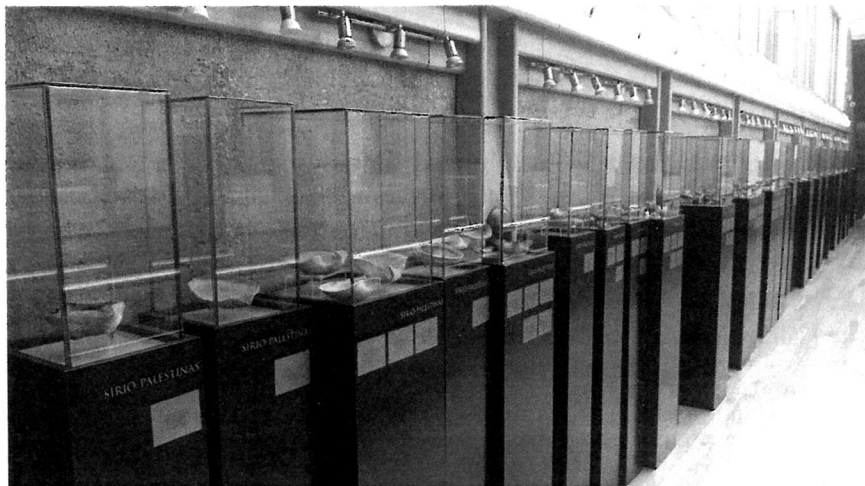
Fig .1. Colección de lucernas exposta na sala 28 do MPL.